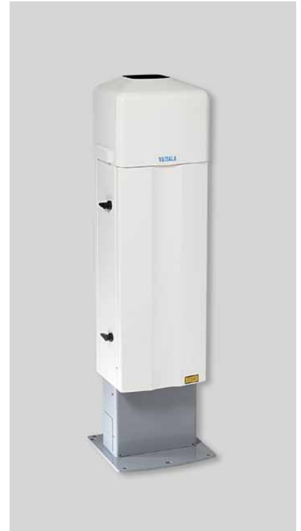
维萨拉CL31云高仪可以在所有天气条件下，无论晴天还是阴天，都可以测量云底高度。

CL31很易于安装。它具有一个防辐射罩，可以保护该设备在雨天不受影响，并抵御在极端情况下受到温度过热或过冷的影响。带有加热器的自动吹窗器可以保持窗户的干燥和清洁，从而提高了设备的性能。在寒冷状态下，加热装置可以防止窗户结霜。